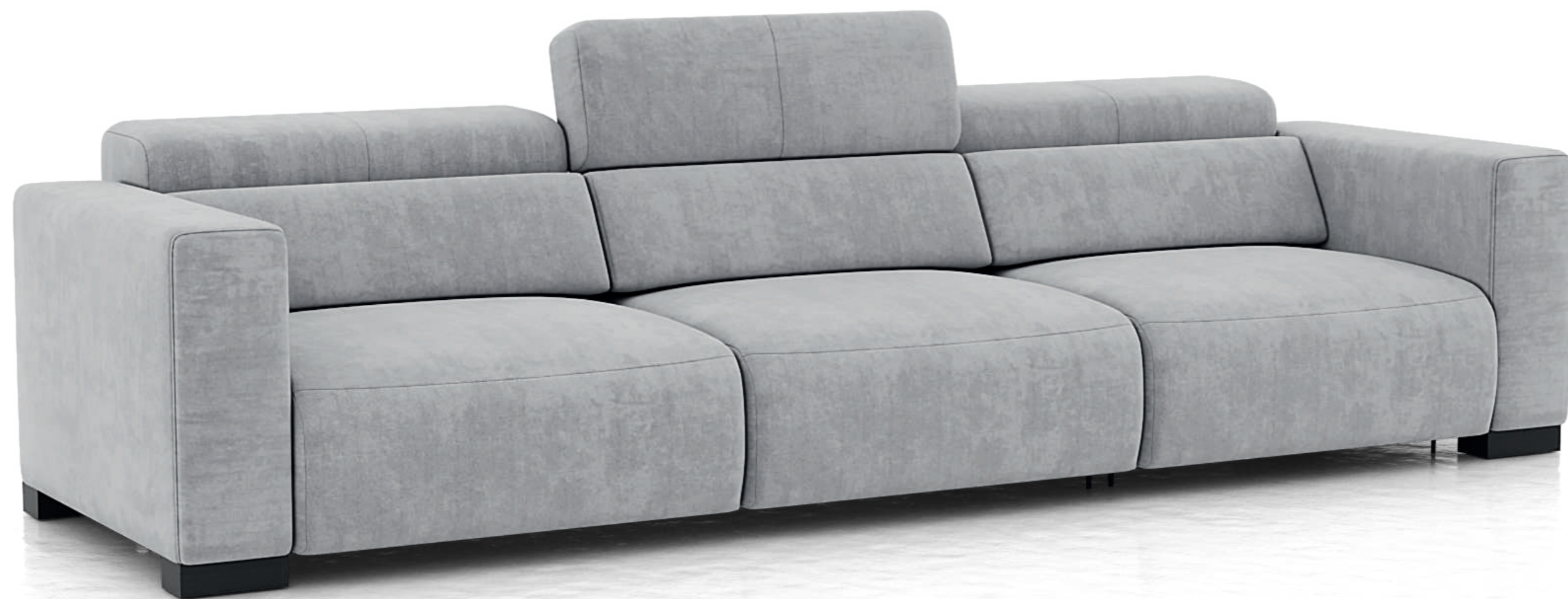
Привексо 20В-90Р2R-90Р1-20В ст. 62/42/6