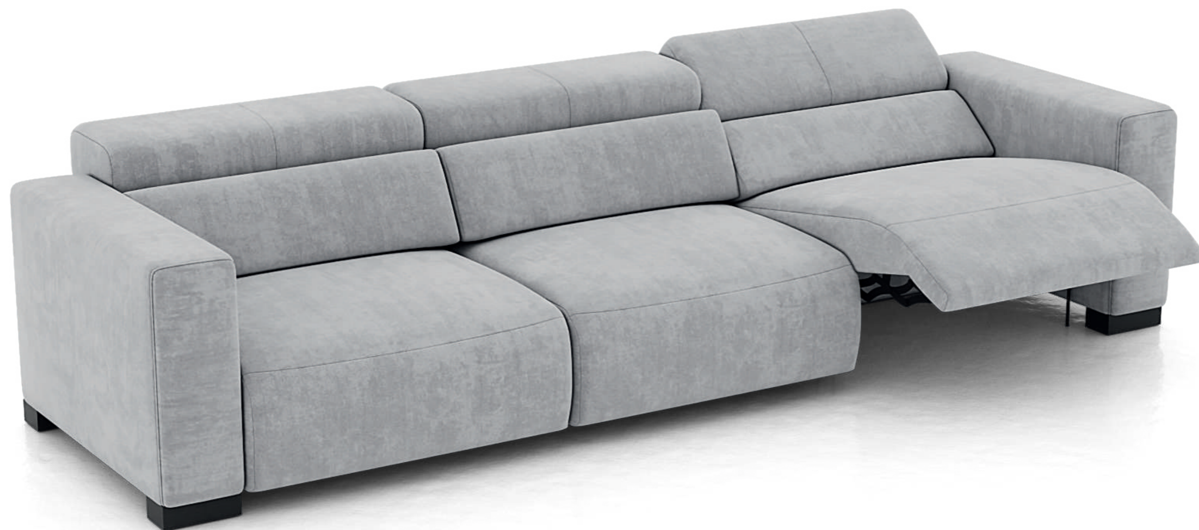
Привексо 20В-90Р2R-90Р1-20В ст. 62/42/6, механизм Рита